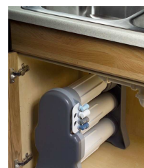
umístění pod kuchyňskou linkou